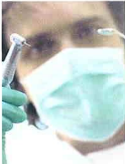
Ist Bohren bald überflüssig?

Ein bisschen hört es sich wie eine Art biologische Kriegführung an: Gute Mikroben töten die bösen Mikroben. Forscher in den USA und Deutschland arbeiten derzeit an neuartigen Mundwässern, die Karies-Bakterien wiederum mit Bakterien bekämpfen. Das berichtet Financial Times Deutschland. Bereits 2007 soll das erste Mittel auf dem deutschen Markt kommen. Sind also Bohrer und Betäubungsspritze beim Zahnarzt bald überflüssig?